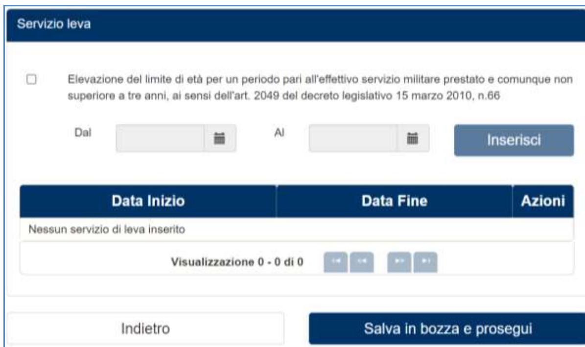
Figura 10 Servizio leva

Nella pagina è presente una sezione relativa a “Servizio leva”. Qui l’utente può richiedere l’elevazione del limite di età, specificando il periodo dell’effettivo servizio militare prestato che consente di elevare il limite di età per un massimo di ulteriori tre anni.