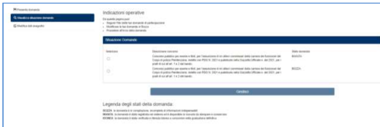
Figura 13 - Visualizza situazione domande

Nel caso di domande presenti nello stato “BOZZA” (e cioè domande ancora in compilazione), selezionando la domanda e cliccando il bottone “Gestisci” è possibile modificare la domanda in bozza.